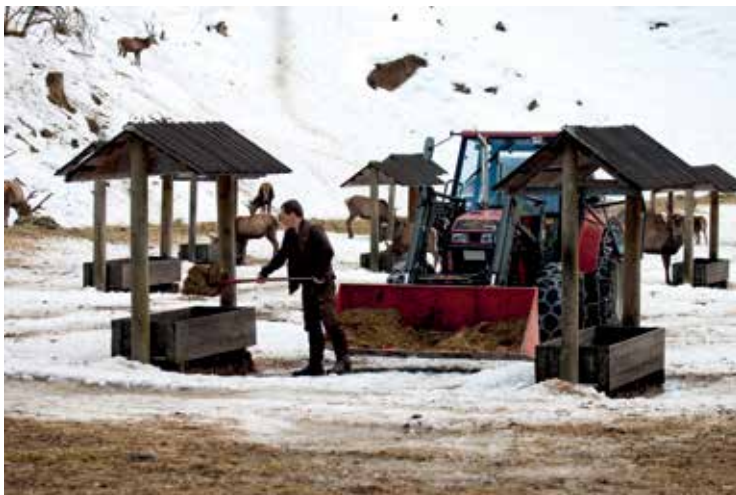
Der Berufsjäger bei der Winterarbeit