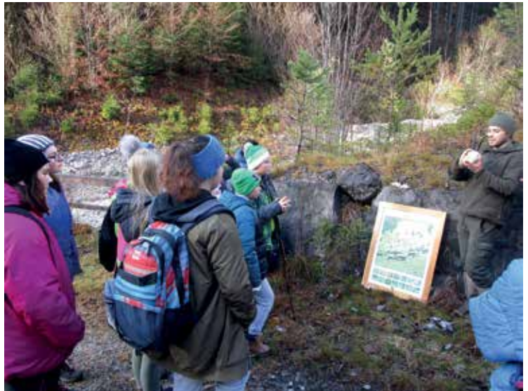
Martin bei der Präsentation jagdlicher Spezialitäten

Ein intensiver Flächenbezug in einem Reviersystem ist besonders hilfreich bei der Herausforderung, selbständig ein Revier bis zu einer Größe von 1.000 ha zu leiten, und damit liegt die Kompetenzfrage damit auf der Hand. So eine Fläche scheint überschaubar und machbar bei durchschnittlicher Waldausstattung und Wilddichte. Ein Einschlag von ca. 1.000 – 1.500 fm