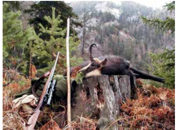
Revieralltag im Hochgebirge

liegen zweifelsohne in dem Instrument einer akkordierten forstlichen und jagdlichen Raumplanung (Schwerpunktbejagungsgebiete, Wildruhezonen), einem geordneten, mit Gemeinden und Tourismus abgestimmten Besucherlenkungssystem (Vorbild „Respektiere deine Grenzen“) und einer offenen und professionellen Kommunikation nach innen (Eigentümer, Jagdpächter, Mitarbeiter) und nach außen (Reviernachbarn, Öffentlichkeit, Naturnutzer). Wenn diese Möglichkeiten befolgt