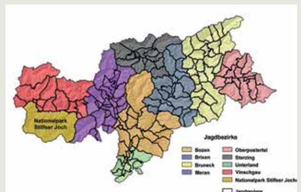
8 Jagdbezirke mit ihren 145 Jagdrevieren