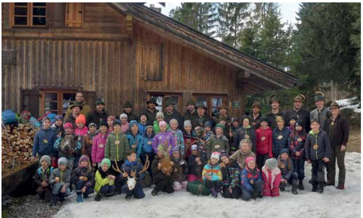
Die Berufsjägerlehrlinge 2018 beim praktischen Unterricht in Jagdpädagogik

Falls es zu einer Einigung über eine einheitliche Ausbildung kommt, überwiegen ganz klar die Vorteile, weil dadurch eine bessere Zusammenarbeit zwischen Forst, Jagd, Naturschutz und Tourismus (hoffentlich) gegeben sein wird. Ein großer Knackpunkt bei den Verhandlungen mit den Landesobmännern sind allerdings die länderspezifischen Unterschiede, vor allem was die Forstausbildung betrifft. Es gibt in ganz Europa keine zweijährige forstliche Ausbildung – außer bei uns in Österreich. Was passiert mit den Quereinsteigern (älter als 25 Jahre), die nicht die