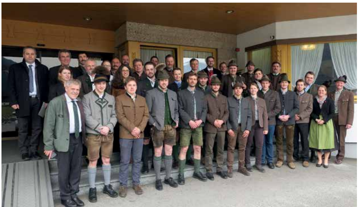
Die Absolventen des Berufsjägerkurses 2018