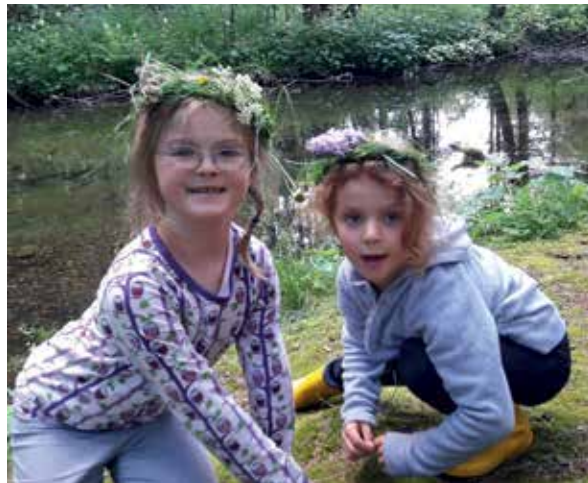
Die Jüngsten sind die wichtigsten Ansprechpartner für die Waldpädagogik

bei einer Maschinenausstattung mit Forstraktor und Personalressourcen von 1 – 2 Facharbeitern ist ausreichend und überschaubar.